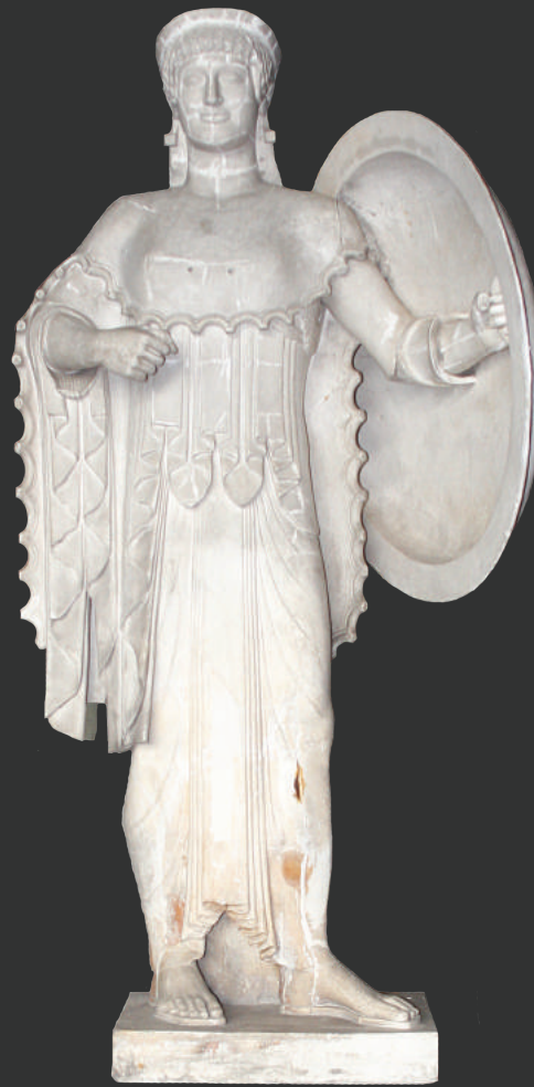
Το φυλλάδιο τυπώθηκε με την ευγενική χορηγία του Ιδρύματος «Α.Γ. Λεβέντης»

Ώρες λειτουργίας: Δευτέρα έως Παρασκευή 8.30' - 16.30'