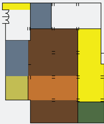
2 ος όροφος Φιλοσοφικής Σχολής